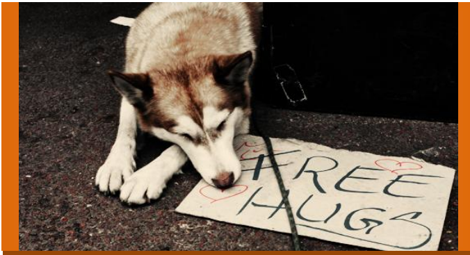
Occupy Amsterdam 2011

Instagram , Dagelijks maak ik foto's, meestal met mijn iPhone, van wat ik tegenkom onderweg. Deze foto's plaats ik op Instagram. Instagram is een foto-community voor iPhone gebruikers, maar mijn foto's zijn ook te bekijken via Twitter of op Facebook. Heb je een Instagram-account dan kun je mij volgen, mijn gebruikersnaam: ashotsphoto . Zie een selectie hieronder: